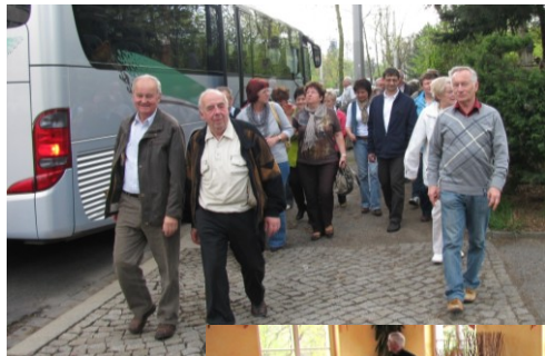
Dresdner Ostern 20.04.