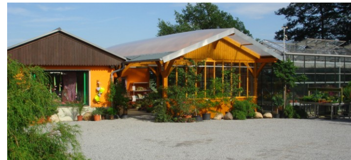
Die Gärtnerei Horbank heute