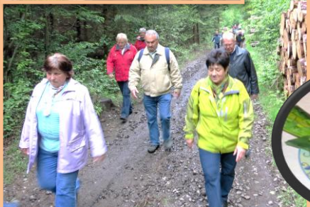
Hronow 18. Mai