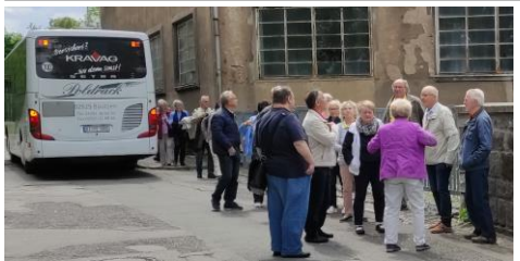
Löbau Haus Schminke 29. Mai